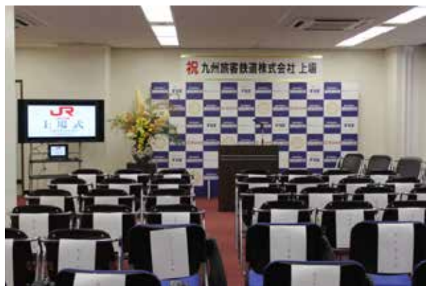
上場式会場の様子

この後、九州旅客鉄道(株)の上場を祝うために、幹事証券会社、上場準備に携わられた関係者の方々など、総勢で約70名の方にご列席いただき上場式典を執り行いました。