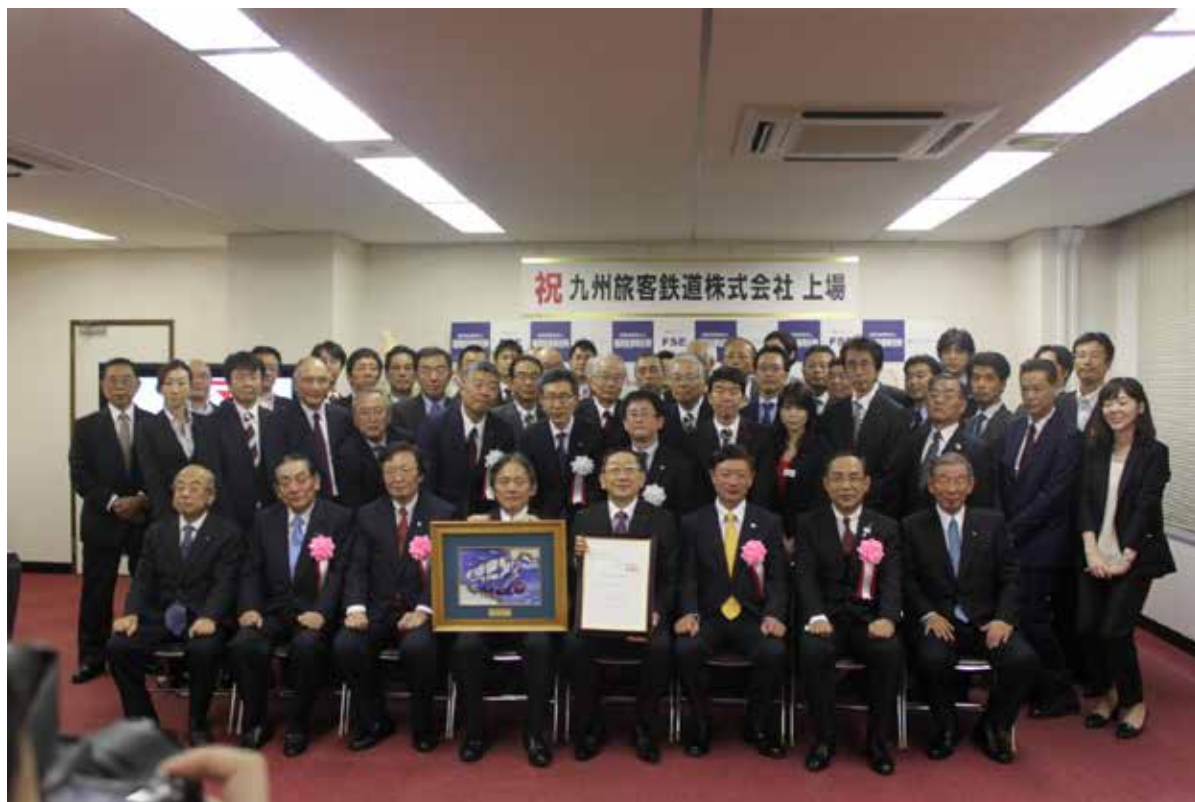
関係者一同による記念写真