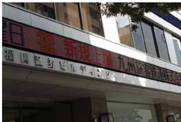
証券ビルボードにも九州旅客鉄道(株)本則新規上場のお知らせが流れる