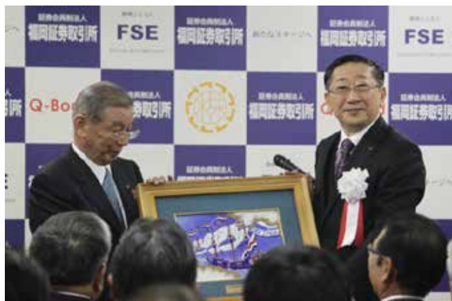
上場記念品としてオランダ船出帆陶額が贈られました。