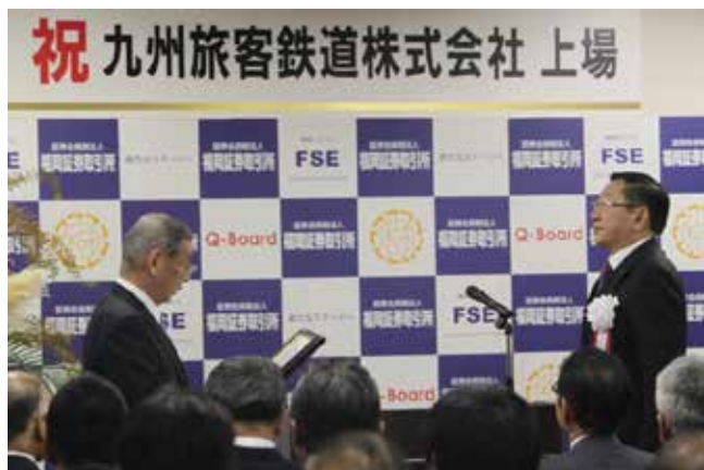
奥井理事長からの有価証券上場通知書の授与