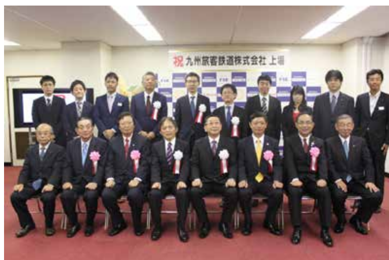
（九州旅客鉄道柳青柳社長、来賓、取引所役員による記念撮影）

有価証券上場通知書を手にする福岡証券取引所の奥井理事長（左）と九州旅客鉄道柳青柳社長（右）