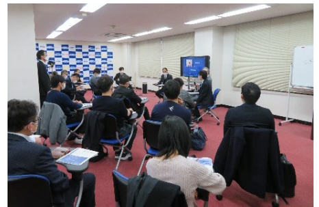
(セミオープンセミナーの様子)

セミオープン…挑戦隊企業以外の一般の方も参加可能なセミナー クローズ ……挑戦隊企業のみ参加のセミナー