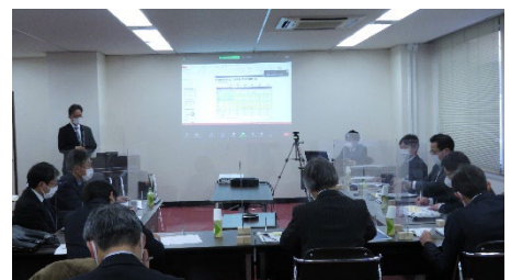
(クローズセミナーの様子)