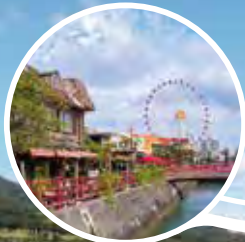
北谷: アメリカンビレッジ