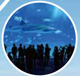
本部: 美ら海水族館