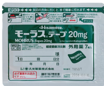
モーラス ® テープ 20 mg