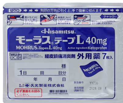
モーラス ® テープ L40 mg