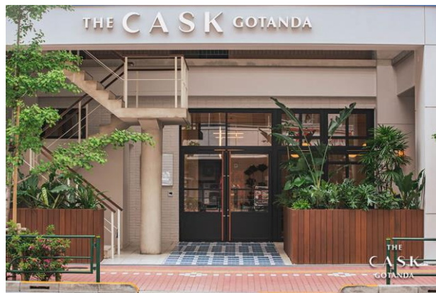
東京オフィスが入居するTHE CASK GOTANDAの外観（エントランス付近）

東京オフィスの設置先となるTHE CASK GOTANDAはベンチャー企業やスタートアップが多く入居している物件です。首都圏の営業活動に好都合な立地であることだけでなく、入居企業同士の交流やシナジー、協業の機会も期待できることから、当社の東京オフィスに最適な場所と考え、入居先として選定しました。