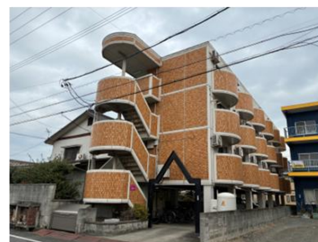
【ローズマンション】 広島県福山市曙町5-3-41 S造_4階建_18戸