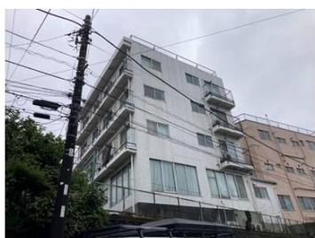
【プレミアム上板橋】 東京都板橋区若木1-72-1 鉄骨造_4階建_18戸