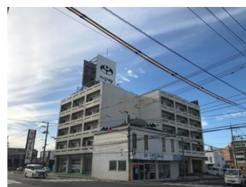
【ラックスビル】 広島県福山市引野町5-19-17 RC造_5階建_27戸