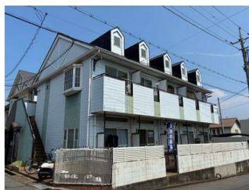
【クレシェンド緑ヶ丘】 広島県福山市引野町北2-11-1 木造_2階建_10戸