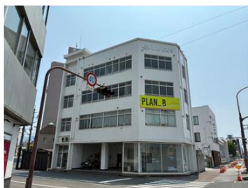
【ラックス第二ビル】 広島県福山市入船町2-1-10 RC造_4階建_4戸