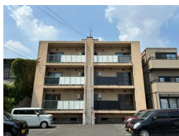
【リノベール王子】 広島県福山市王子町2-100-2 RC造_3階建_6戸